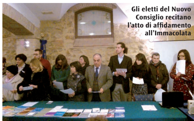
Gli eletti del Nuovo Consiglio recitano l'atto di affidamento all'Immacolata

Il 26 gennaio si è svolta a Piazza Armerina, presso l'hotel "Villa Romana", l'assemblea elettiva dell'Azione Cattolica per il rinnovo del consiglio diocesano. Il cammino assembleare è una tappa fondamentale della vita associativa dell'AC, si qualifica come momento di corresponsabilità ed esercizio della democrazia, questi sono principi fondamentali che caratterizzano l'Azione Cattolica a tutti i livelli: parrocchiale, diocesano, regionale e nazionale.