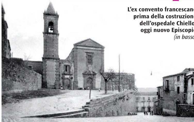
L'ex convento francescano prima della costruzione dell'ospedale Chiello, oggi nuovo Episcopio (in basso)