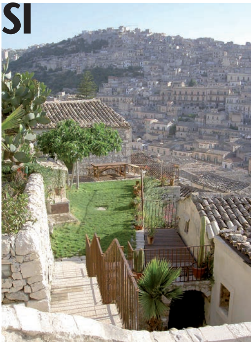
Il B&B Casa Talia di Modica che aderisce all'iniziativa

In occasione del B&B Day verrà rilasciato anche il "Rapporto B&B Italia 2014" che va ad aggiornare gli studi degli anni 2007 e 2011 in cui si indagano le ragioni di successo del B&B in Italia attraverso una specifica ricerca statistica, condotta su un campione di circa 2500 B&B, diffusi su tutto il territorio nazionale. Il sondaggio e lo studio statistico verranno presentati alla stampa, in occasione del B&B Day e costituiranno la fotografia più aggiornata di