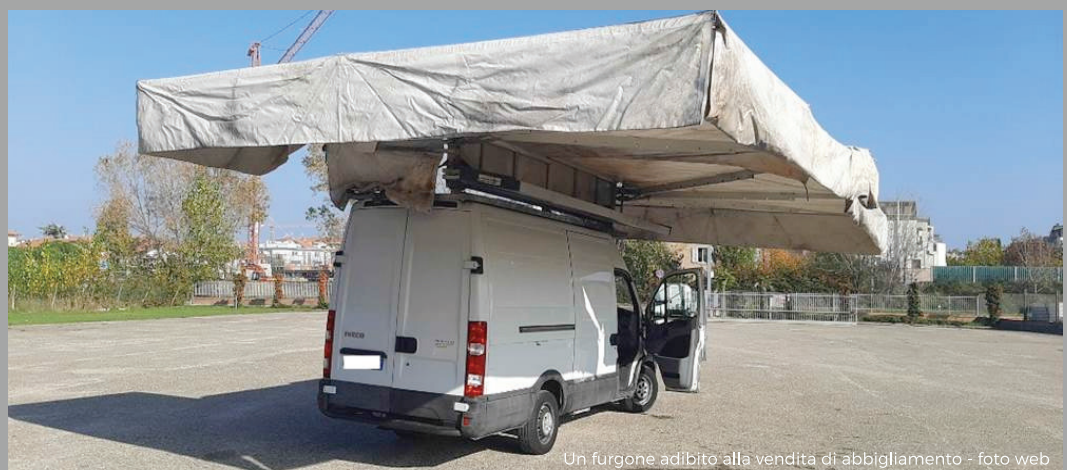
Un furgone adibito alla vendita di abbigliamento

Qualsiasi cosa riusciamo a fare per quanti bussano alla porta, ci rende orgogliosi pastori di una Chiesa misericordiosa, attenta ai bisogni del prossimo.