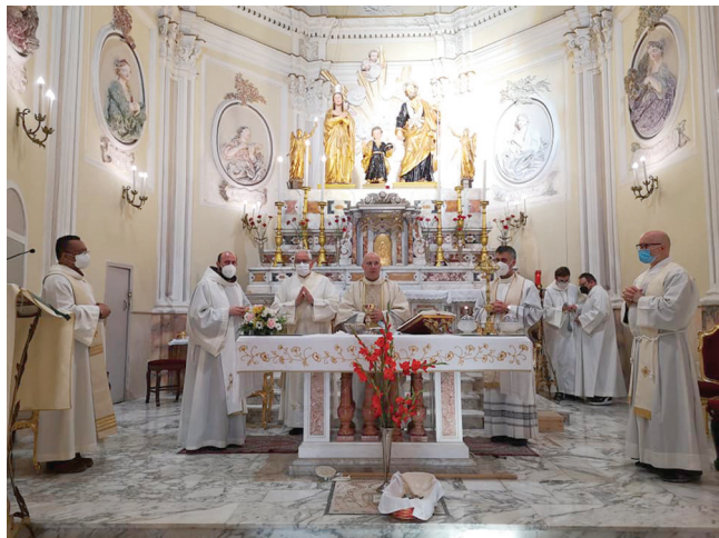
Un momento della celebrazione di saluto alla Città di Enna