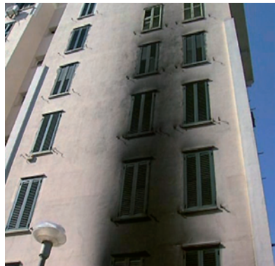
Macchitella - La facciata della palazzina di via Pistici

Scuole a soqquadro, attentati incendiari sulle auto e fuoco nei garage. A Gela continua l'allarme sicurezza. Ogni giorno il mattinale delle forze dell'ordine riporta un vero bollettino di guerra. Qualche giorno fa il Terzo circolo nel mirino dei vandali, nel plesso di Cantina Sociale. Ma l'episodio che ha scatenato lo sconcerto dei cittadini è stato l'attentato nella rimessa di uno stabile di via Pistici che ha rappresentato il momento clou della paura in città. Il fuoco ha distrutto cinque ciclomotori, il piano terra dello stabile e la facciata, fino al settimo piano. Ma quello che ha sconvolto l'opinione pubblica è stata la paura che hanno