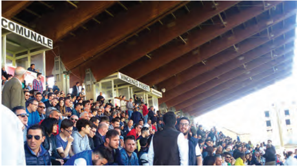
La tribuna coperta dello stadio inagibile

La copertura della tribuna è pericolante da tempo e questo è valso a far chiudere la struttura sportiva due anni fa, sotto l'amministrazione Messinese. E da allora è stato un crescendo di incontri, ricerca vana di fondi, di proteste. La copertura è sempre lì e ancora pericolante. Eppure qualcosa sembra muoversi per la risoluzione del