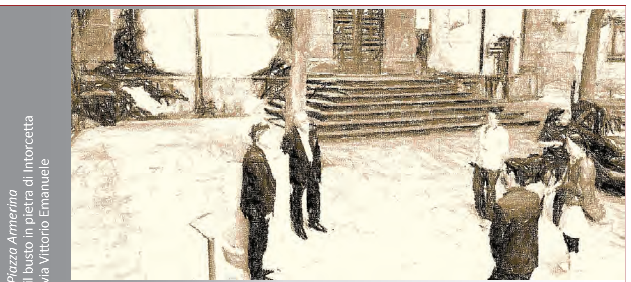
Piazza Armerina il busto in pietra di Intorcetta via Vittorio Emanuele

Cambiare prospettiva per vedere nuove opportunità. Scambi tra culture veicolate da persone culturalmente diverse.