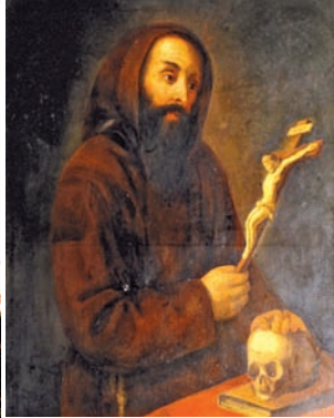
La parrocchia di Maria SS. delle Grazie e un'immagine di fra' Matteo Da Bascio, fondatore dell'Ordine dei Cappuccini

La ricorrenza del Bicentenario della presenza della Madonna delle Grazie a Gela (1813 - 2013), al di là dei festeggiamenti in corso che culmineranno il 9 luglio, è stata