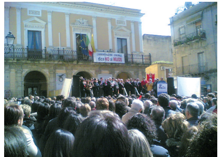
La manifestazione No-Muos indetta a Niscemi l'estate scorsa