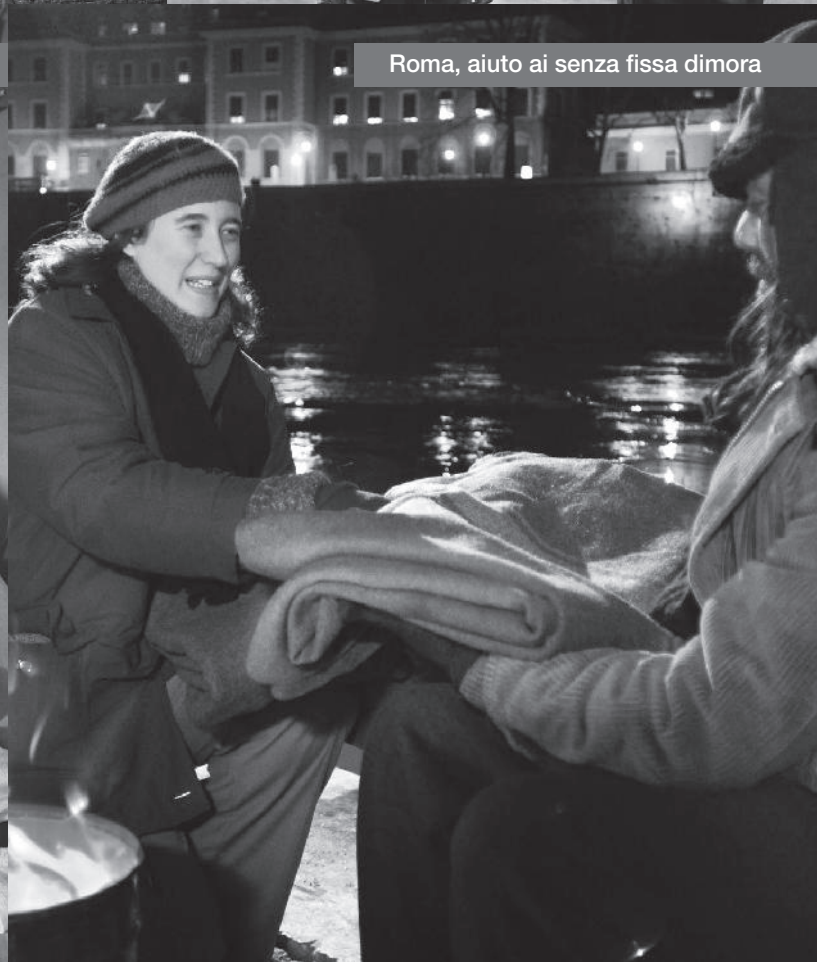
Roma, aiuto ai senza fissa dimora