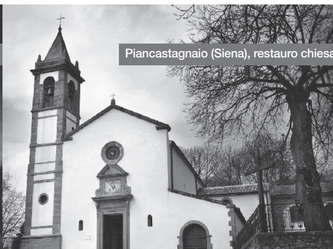
Piancastagnaio (Siena), restauro chiesa