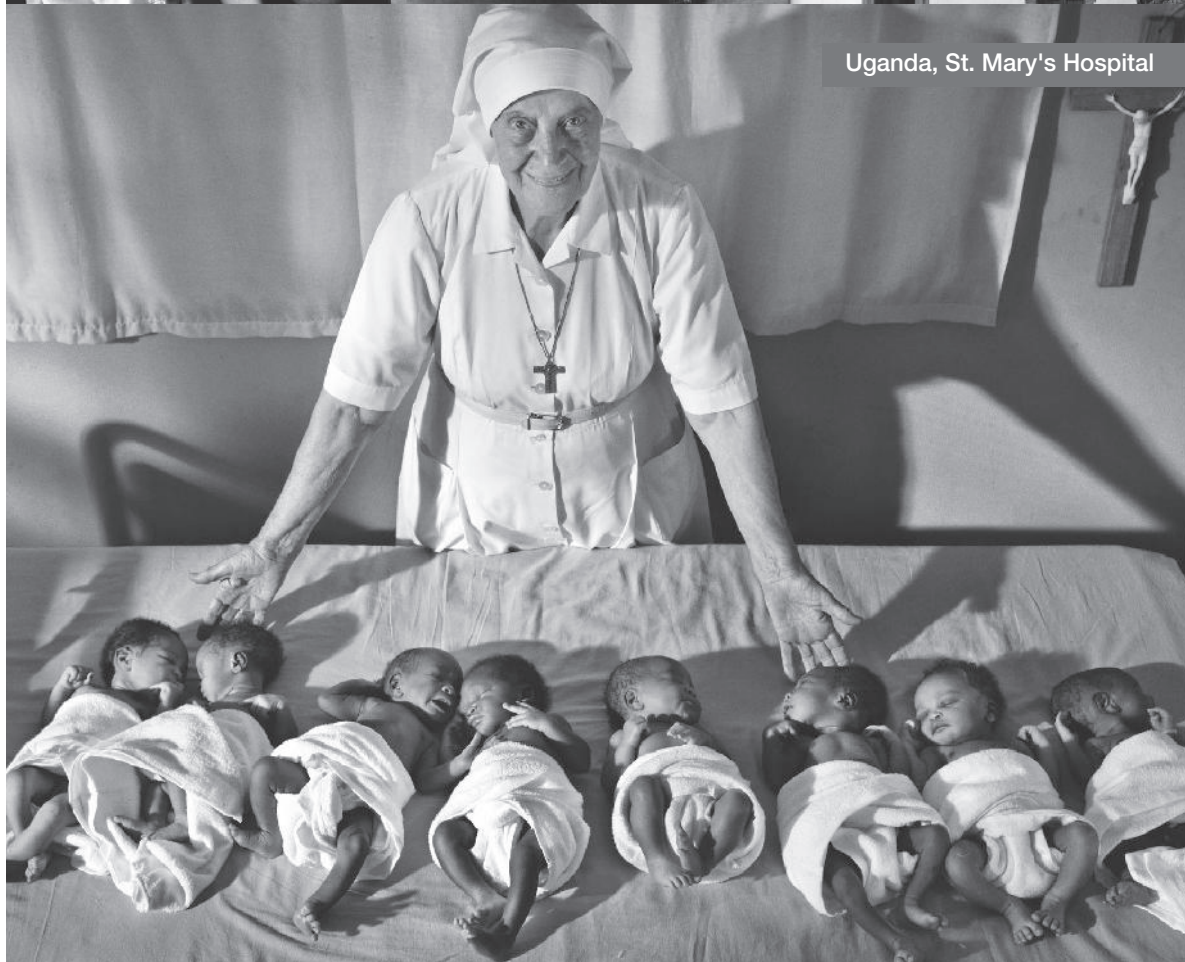
Uganda, St. Mary's Hospital