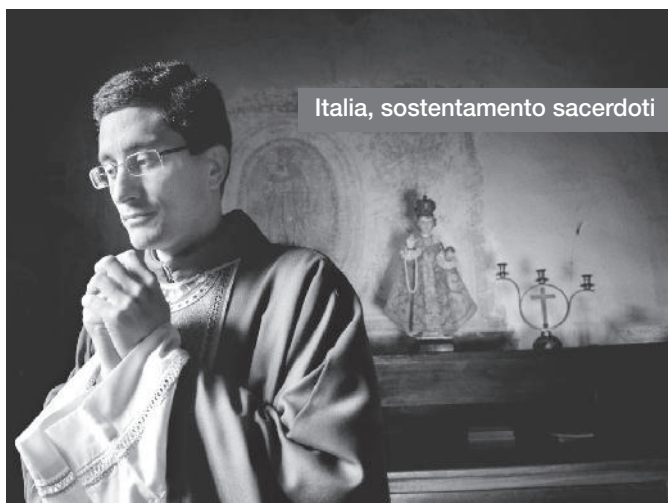
Italia, sostentamento sacerdoti