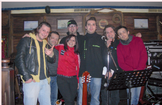
I “Sintetico” e i “SenzaRadio” durante una serata del “Festival Pub Italia”