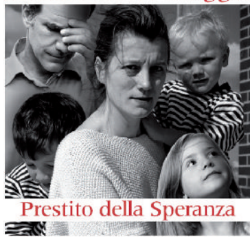
Prestito della Speranza

no perso l'unico reddito, con almeno tre figli oppure segnate da situazioni di grave malattia o di disabilità". Si può ritenere che il numero delle famiglie in queste situazioni si aggiri tra le venti e le trentamila. Il fondo viene istituito di concerto con l'Associazione Bancaria Italiana (Abi), che a sua volta ha proposto a tutte le banche di aderire all'iniziativa. Non eroga direttamente denaro, ma costituisce un capitale a garanzia degli interventi da parte degli istituti di credito aderenti. Si affianca, senza sostituirla, all'attività svolta abitualmente dalle Caritas diocesane e da