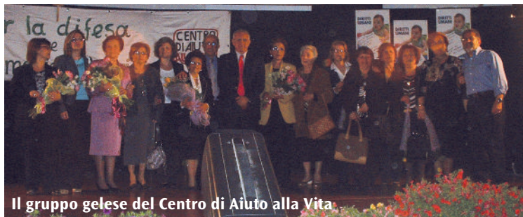
Il gruppo gelese del Centro di Aiuto alla Vita

C'è chi batte il record nello slalom gigante, chi nelle scalate dei monti; chi nella misure del corpo. Il Centro di aiuto alla vita di Gela batte il record nel favorire la vita: in trent'anni di attività di volontariato sul territorio di Gela ha aiutato a continuare a vivere nel grembo della mamma 2.500 bambini, oggi uomini e donne, madri e padri a loro volta. Per festeggiare i 30 anni di servizio alla vita il Cav di Gela ha organizzato il recital di canti, danze e poesie dal titolo: 'Evviva la mamma' che si è tenuto nell'auditorium dell'Istituto tecnico commerciale 'Luigi Sturzo', in occasione della Festa della mamma: protagonisti i bam-