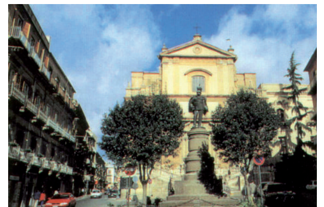
La statua di Umberto I sullo sfondo la chiesa di S. Agata