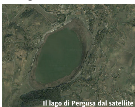
Il lago di Pergusa dal satellite

La manifestazione, che si svolgerà interamente all'interno dell'Autodromo, prevede due tragitti, rispettivamente di 4.950 m. e 9.900 m. a ritmo libero ovvero, ognuno può percorrere il tragitto prescelto nella scheda di partecipazione, alla velocità che ritiene più opportuna. Il percorso sarà completamente chiuso al traffico. Possono