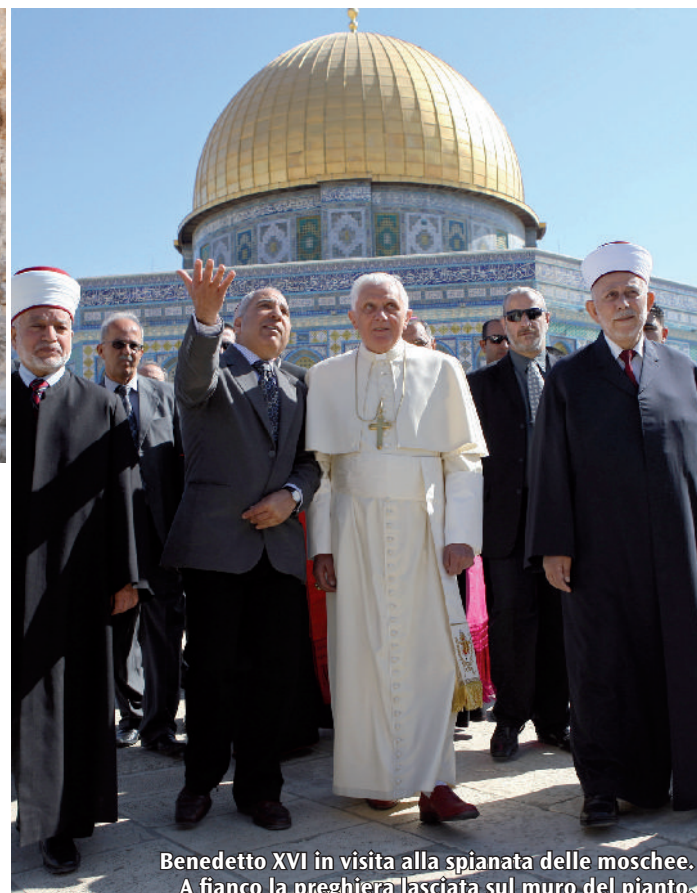
Benedetto XVI in visita alla spianata delle moschee. A fianco la preghiera lasciata sul muro del pianto.

Passi per un dialogo che non escluda nessuno, che non dimentichi le ragioni e i torti, ma che li superi in un disegno più grande. Scri-