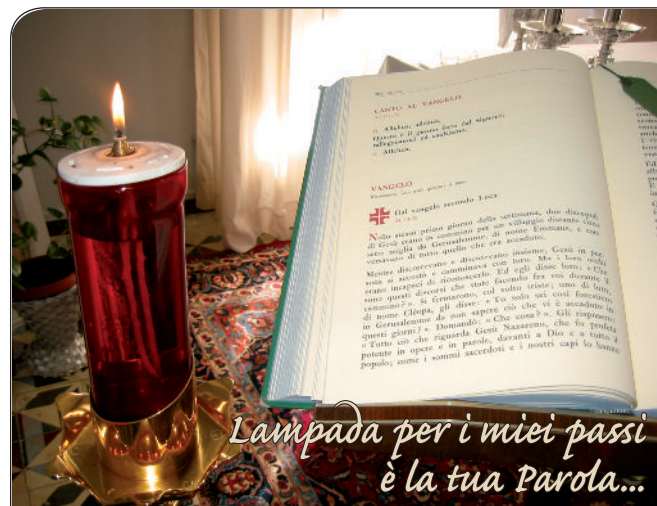
Lampada per i miei passi è la tua Parola...