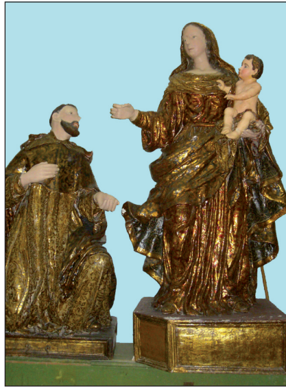
Sopra gruppo scultoreo del XXVIII secolo della Madonna del Rosario. Chiesa di Sant'Ignazio a Piazza Armerina