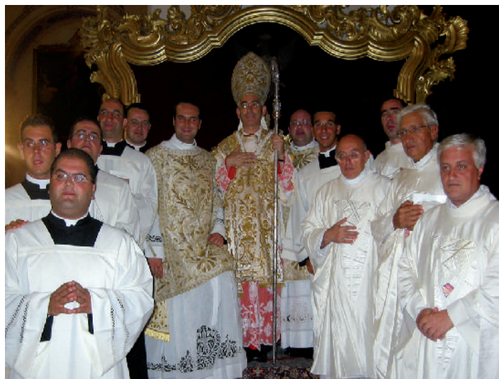
I nuovi diaconi con i seminaristi istituiti Lettori e Accoliti assieme ai responsabili della formazione del Seminario dopo la liturgia

Dopo la liturgia la comunità del Seminario ha voluto condividere insieme agli intervenuti un momento di convivialità e di festa presso i locali del seminario estivo di montagna Gebbia.