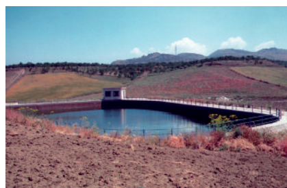
Un invaso realizzato con l'acqua della diga Olivio nei pressi di Mazzarino

PROVINCIA DI ENNA Trentadue i progetti in provincia per le Associazioni di Volontariato