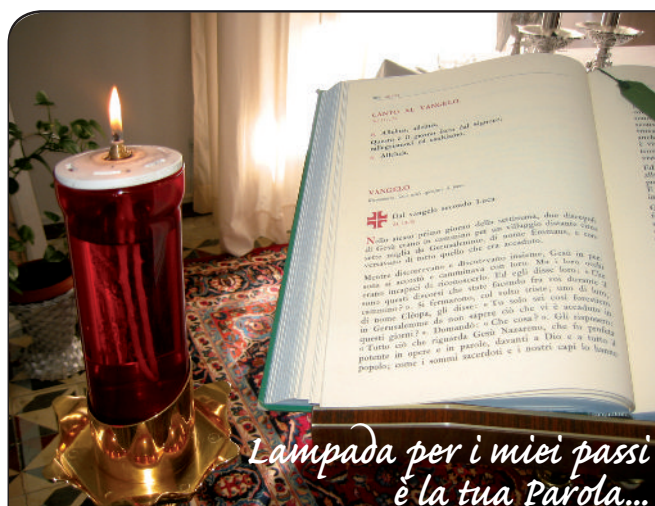
Lampada per i miei passi è la tua Parola...