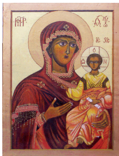
La Madre di Dio di Smolensk