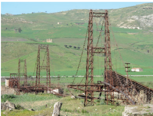
In alto le sitallazioni della miniera. In basso il museo delle zolfare ubicato nell'ex centrale elettrica Palladio tra il territorio di Sommatino e Riesi

Lunedì 8 marzo, dopo 6 anni di lavoro su un progetto costato oltre 5 milioni e mezzo di euro che