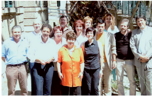
Le Unità Operative di Medicina Scolastica

Inoltre dai controlli di approfondimento di secondo